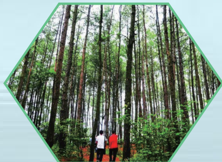
▲游客在金城山森林公园游玩