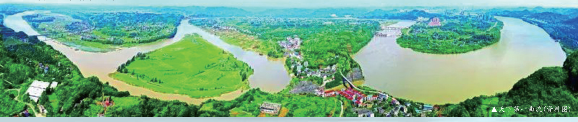
▲天下第一曲流(资料图)