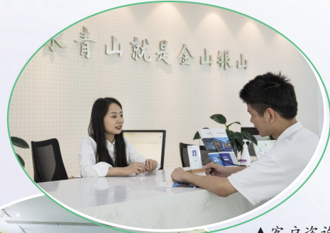
▲客户咨询办理“两山银行”业务

据悉,金源站试点项目项目总投资6070万元,目前已有参与农户60户,参与经营人数100人,打造古民居16栋,精品民宿6间。截至2021年底,根据地接待游客5.2万人次,旅游总收入620万元,其中餐饮住宿收入390万元,带动就业和农产品销售220万元;民宿接待游客3.2万人次,收益410万元。