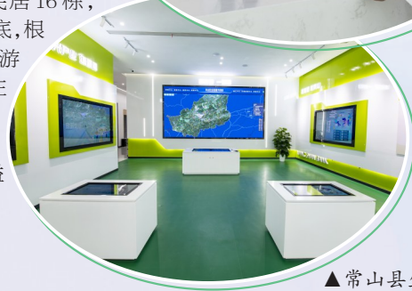
▲常山县生态资源数字驾驶舱