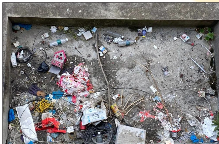
时间:7月7日 地点:江滨小区3幢东单元 存在问题:卫生死角 包干单位:县人社局