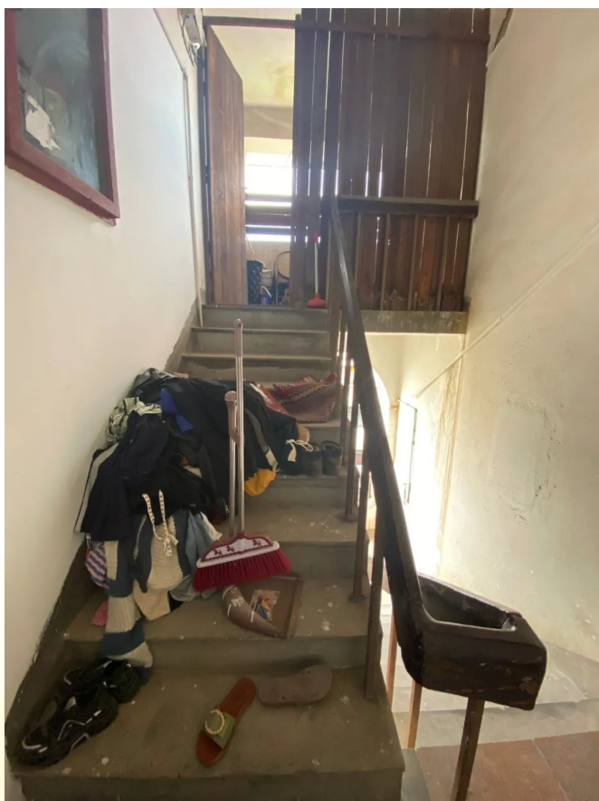
时间:7月7日 地点:梅园小区56幢西单元 存在问题:楼道内乱搭建、乱堆放 包干单位:市生态环境局常山分局