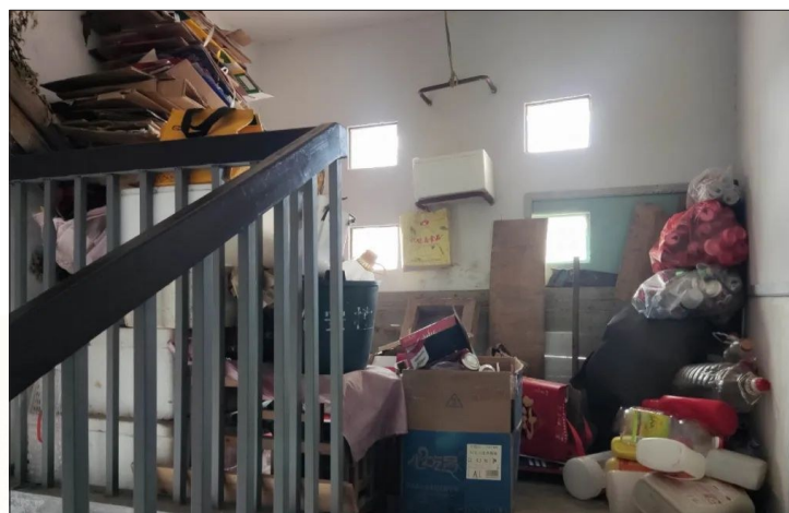
时间:7月7日 地点:锦翠花园二期9幢2单元 存在问题:楼道内杂物乱堆放 包干单位:县退役军人事务局