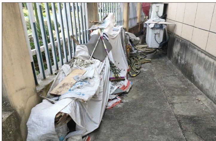
时间:7月7日 地点:江北农民新村299-303号 存在问题:乱堆放 包干单位:紫港街道