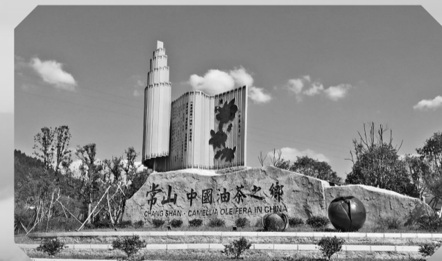
▲常山中国油茶之乡