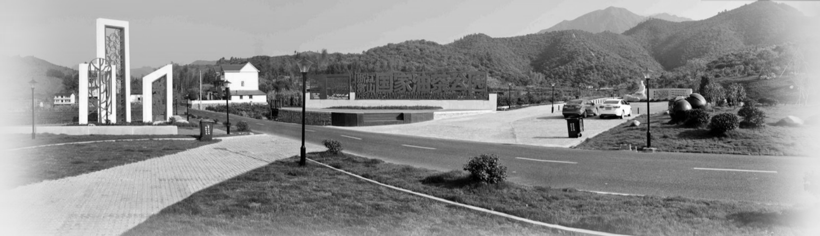
●浙江常山国家油茶公园

常山栽植油茶有2000多年历史,有“中国油茶之乡”“浙西绿色油库”之称。全县油茶种植面积28万亩,2021年油茶籽产量7500吨,油茶籽油产量1800余吨,其种植面积和产量均居浙江省首位,油茶产业总产值超10亿元。 近年来,常山县委、县政府高度重视油茶产业的发展,围绕实施乡村振兴战略目标,提出打造“中国好油”“中国油茶小镇”目标,建成“一区两园四中心”,成功举办了三届中国·常山油茶博览会暨全国油茶文化节,荣获全国油茶交易中心、全国山茶油价格指导中心、国家油茶公园、全国经济林产业区域特色品牌建设试点单位等“国字号”牌子,并成为首批“全国木本油料特色区域示范县”。全国油茶交易中心金融性平台——东海常山木本油料运营中心于2018年11月正式上线运营,率先在全国实现油茶籽现货交易,并将逐步构筑“原料和市场在外、交易和结算在常”的产业高端运作模式,实现资源集聚常山。与新华社联合制定“新华·中国油茶产品价格指数”,扩大品牌影响力,塑造中国油茶品牌形象。