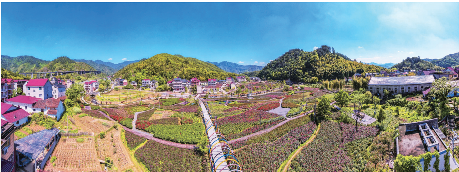
▲新乡乡生机勃勃的乡村景象