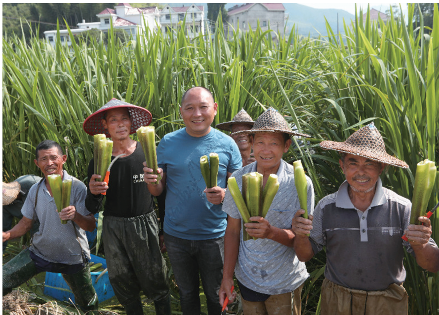
▲达塘村茭白喜丰收

山县还出台了激励引导“常雁”回村发展的意见,从政治激励、经济待遇、生活保障等多个维度帮助新乡贤成长。