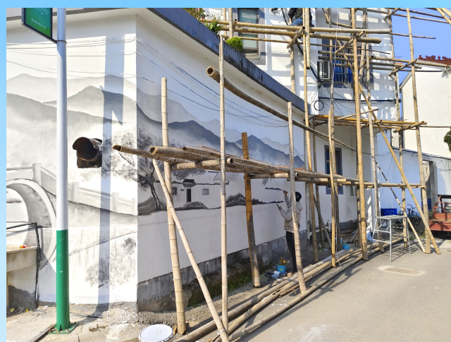
▲墙绘,让乡村更美丽