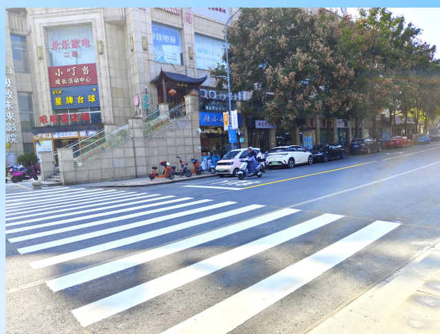
▲白龙路新施划斑马线,让行人通行更安全