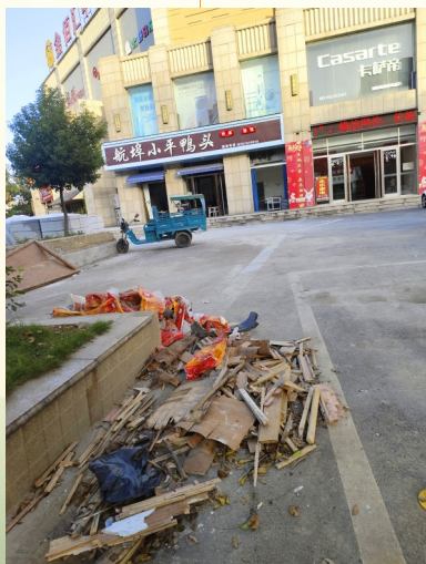
▲金佰汇广场停车区有建筑垃圾