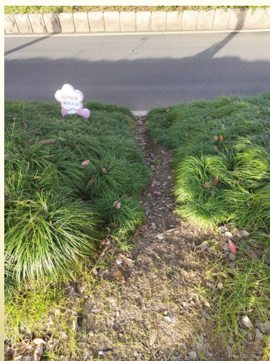
▲绿化带“中分”不可取