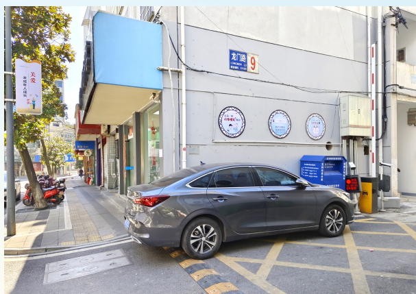
▲车辆占用消防登高点