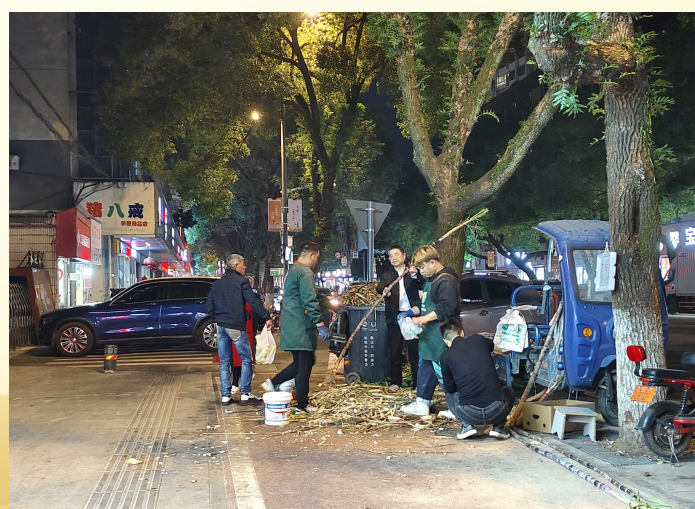
▲在人行道上摆摊售卖甘蔗