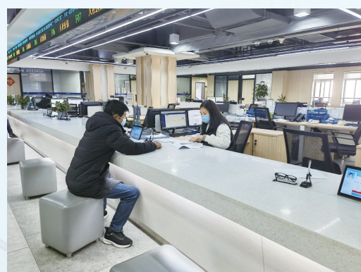
▲县行政服务中心业务办理现场,工作人员热情服务