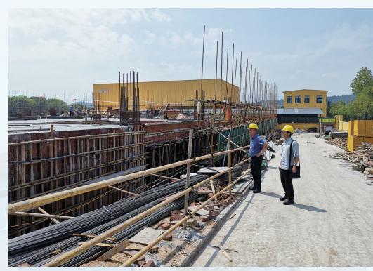
▲服务组前往柚香谷新项目建设现场进行督导

走进浙江灿宇纺织有限公司,县民营经济司法保障服务中心的工作人员正在主动“把脉”企业司法需求,将助企纾困“服务礼包”送进企业。 在“把脉”企业司法需求座谈会现场,工作人员详细了解企业生产的经营状况、发展规划及司法纠纷等情况,认真询问企业在诉讼活动中遇到的困境,以“听询问答”方式解答法律问题,并为他们送上《法治化营商环境审判白皮书》、《买卖合同示范文本》等暖企司法