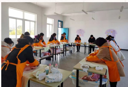
▲“常山阿姨”学院培训现场