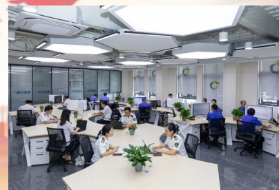
▲县社会治理中心执法平台集中办公区

如今，我县“大综合一体化”行政执法改革率先在全省构建“1+5”县域行政执法格局，改革经验做法获评省改革突破奖；“孝老之城”建设纳入全省“浙里康养”首批“一地创新、全省推广”优秀案例；“留守儿童呵护”应用经验做法纳入全省教育领域数字化改革优秀案例；“公务拼车”列入省数字化改革最佳应用“浙里好管家”子场景；创新实施常山胡柚“一只果”全产业链增值化改革，成功入选2023年全省第三批营商环境最佳实践案例；“新三公”改革获《浙里改（基层首创）》刊发，入选全省营商环境“微改革”项目库……一张张亮眼的成绩单令人鼓舞，催人奋进，为推动常山新一轮高质量发展汇聚起磅礴力量。