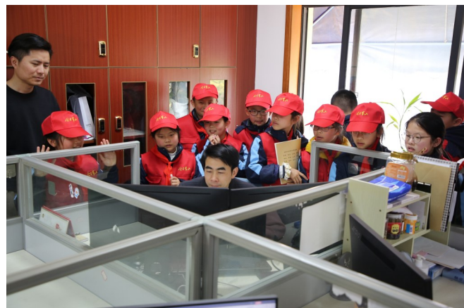
小记者们参观《今日常山》编辑部

这次参观不仅让我学习到了一些关于新媒体的知识，也让我体会到了幕后工作者的辛劳。我也很幸运自己能成为一名小记者，能有这样的机会，以后我要积极参加小记者的每一次活动，因为这样的活动能让我学习到很多知识。