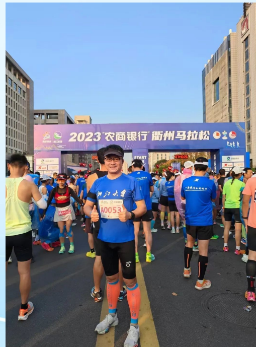
▲刘雪松院士参加2023“农商银行”衢州马拉松比赛